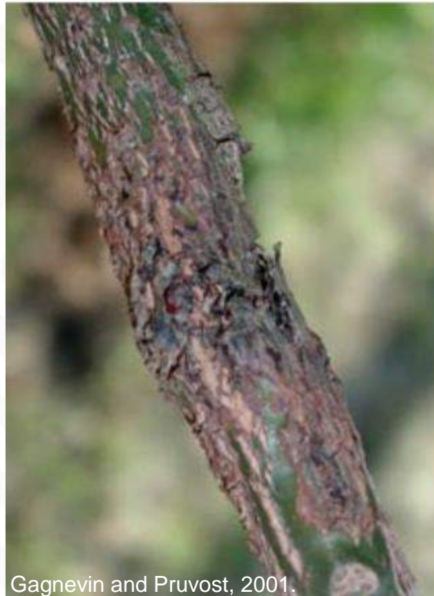
Gagnevin and Pruvost, 2001.

En ramas jóvenes, se observan canchros, los cuales son la principal fuente potencial de inóculo y debilitan la resistencia de las ramas a los vientos.